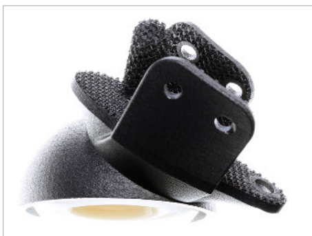
Medizinisches Implantat mit Gitterstruktur