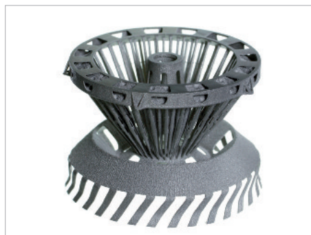
Spiegellager zur Präzisionseinstellung, gefertigt ohne bewegliche Elemente